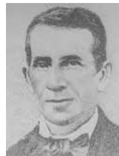
José María Cañas Escamilla

Ignacio Arancibia fue un chileno de toda la confianza de Mora y había encabezado el levantamiento en el suelo porteño antes del arribo de los invasores. Juan Rafael Mora y Arancibia fueron fusilados por acuerdo de un presuroso consejo de guerra que se instaló una vez que las tropas del Gobierno tomaron el control definitivo de la situación. En cambio, José María Cañas recibió la noticia de su ejecución por medio de un decreto de Consejo de Gobierno convocado con premura en la capital costarricense. El comunicado se rubricó y envió con apremio al sitio que sirvió de escenario bélico. Cañas fue ejecutado el 2 de octubre de 1860, dos días después de que su hermano político tuviera el mismo destino.