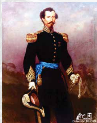
Máximo Blanco.

“La lucha se emprendió por mi parte el 28 último [de setiembre] con un cañoneo que duró tres cuartos de hora, dándose principio a las 8 y 30 de la noche, y 10 ó 12 minutos después cargó un cuadro de oficiales montados, con sable en mano, seguido de un batallón de infantería, que unánimemente en su arrojó se apoderaron de la fortaleza, guarnecida con una batería de siete cañones de frente y protegida por ciento cincuenta rifles”.