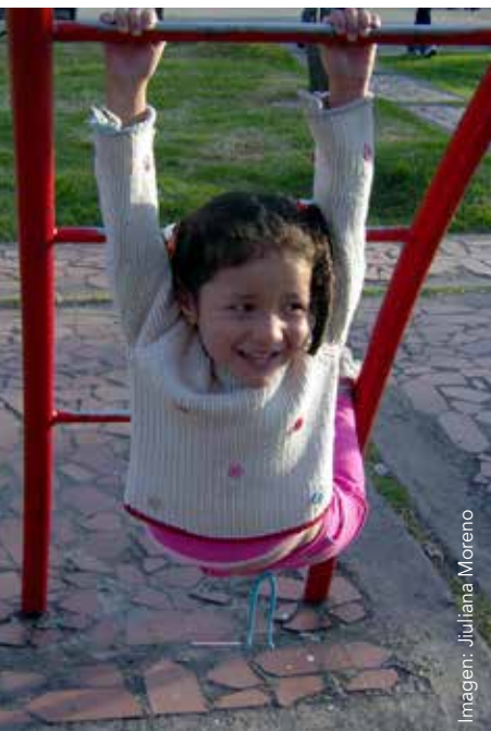
Imagen: Juliana Moreno

■ El juego forma parte esencial en la construcción de experiencias significativas que fortalecen el desarrollo humano; es el medio por el cual se promueven un sinnúmero de actividades que satisfacen las potencialidades del individuo.